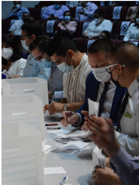
Sesión Ordinaria celebrada en el Teatro Auditorio de la Torre Académica de 21 de mayo de 2021, en la que se llevaron a cabo votaciones para la elección de Rector de la Universidad Autónoma de Sinaloa.