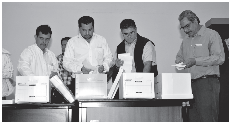
Consejeros Universitarios presentes en el proceso de elección de nombramiento de Directores de Unidades Académicas, sesión ordinaria del HCU del 24 de noviembre de 2016.