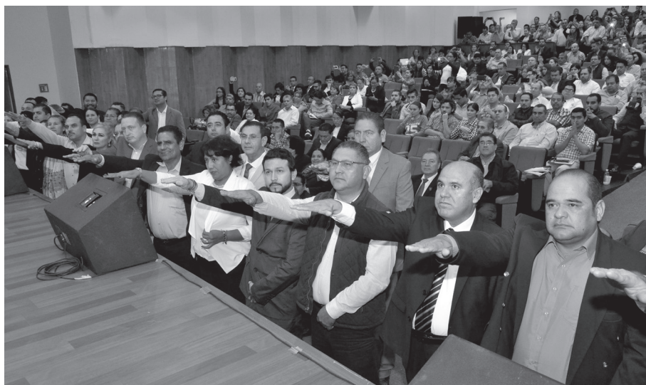
Sesión ordinaria número 26 del H. Consejo Universitario, momento de la toma de protesta de Directores de Unidades Académicas el 16 de diciembre de 2016.