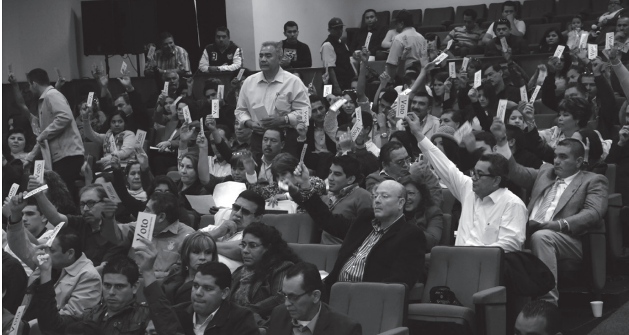
Consejeros(as) Universitarios(as) presentes en la vigésima sesión ordinaria del H. Consejo Universitario, celebrada en el recinto oficial de la Facultad de Medicina.