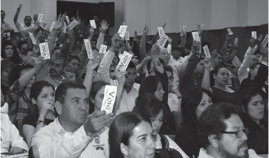
Momentos en que exponen su voto a favor de los nuevos acuerdos, como son el nombramiento de nuevos integrantes para la Comisión Permanente de Postulación.