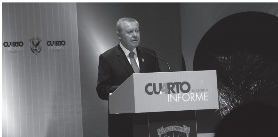
El Dr. Corrales Burgueño al momento de rendir su Cuarto Informe, en la sesión solemne del 29 de mayo de 2013.